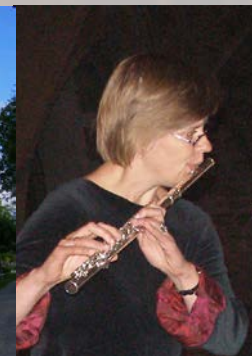
Fløytespel tonar inn kvar del av vigilien