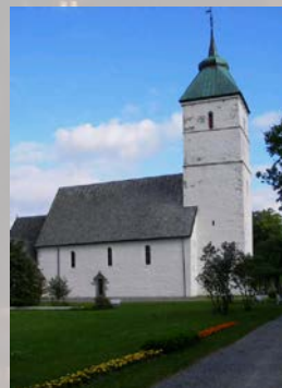
Første kursdag er vi i Værnes kyrkje

kl. 21.00 Completorium i kapittelhuset (bøn før natta)